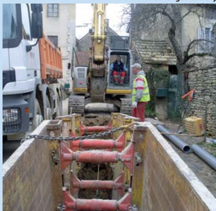
Travaux à Collonges les Bevy