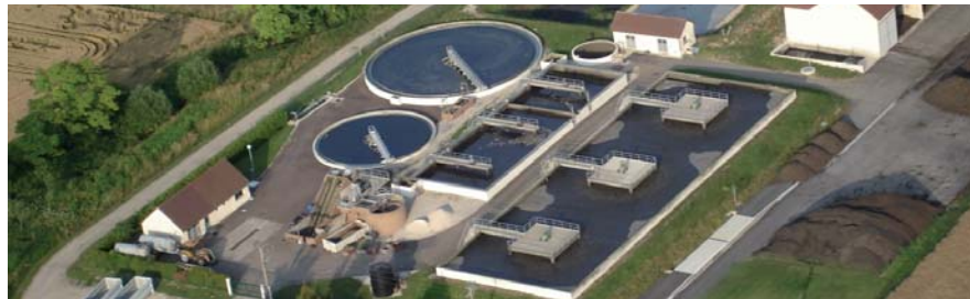
Step de Quincey