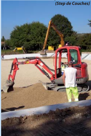
Construction du filtre planté de roseaux (Step de Couches)